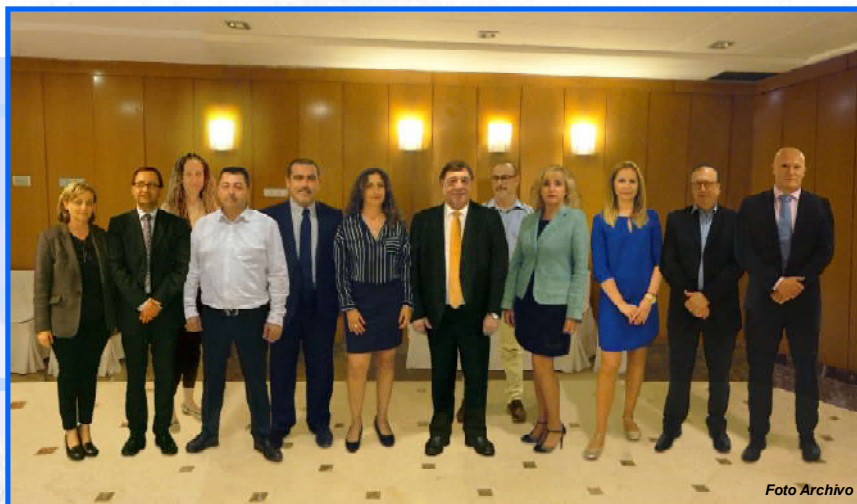
Miembros Directivos, Consultores y Responsables de Áreas

Dicho Informe se remitió con fecha 20-05-2024 de forma personal a cada uno de los Sres. Asociados, a sus correos electrónicos obrantes en el seno de cada Asociación. Igualmente y para una total notificación, se colgó en la página web de cada uno de nuestros Colectivos Profesionales.